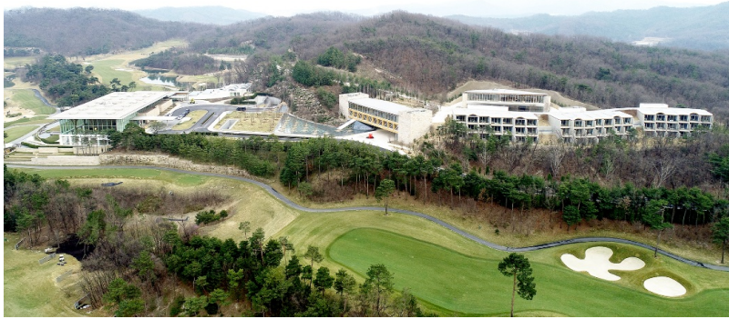
Alle neuen Gebäude des Haesley Nine Bridges Golfklubs im Überblick.