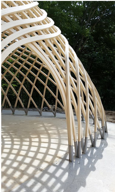
Detailansicht Free Form-Konstruktion