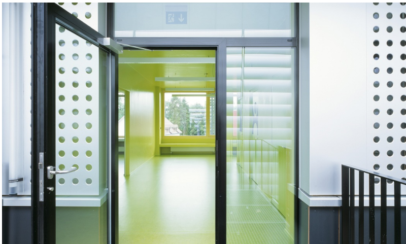
Grosszügiger Eingangsbereich im provisorischen Schulhaus