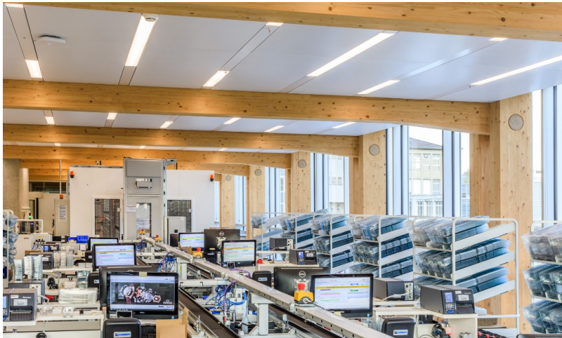
Postes de travail modernes pour la production