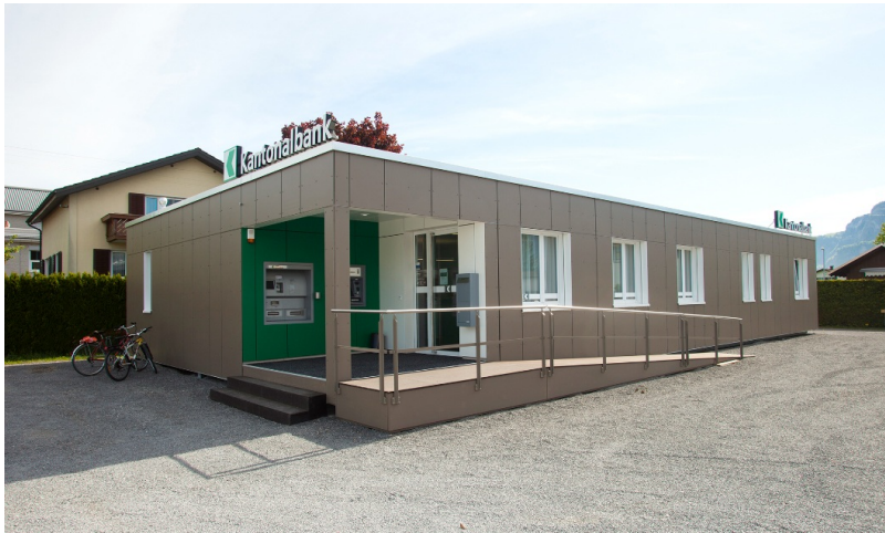
Entrée avec rampe d'accès pour fauteuils roulants