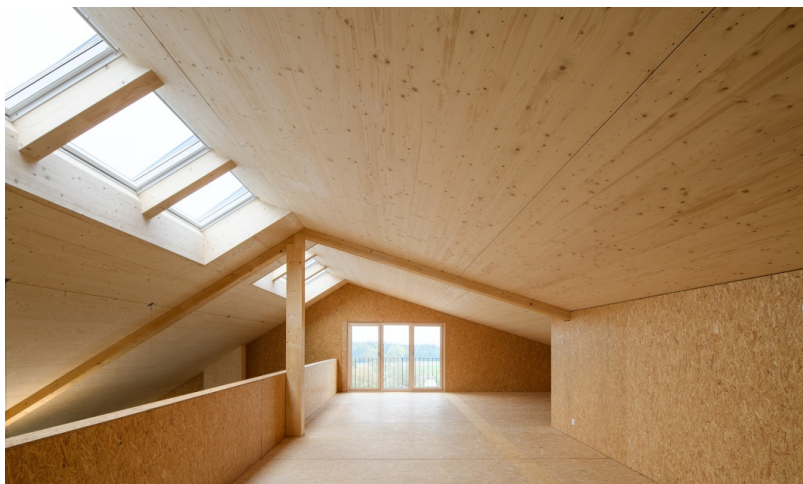
Agrandissement d'une charpente en bois d'épicéa