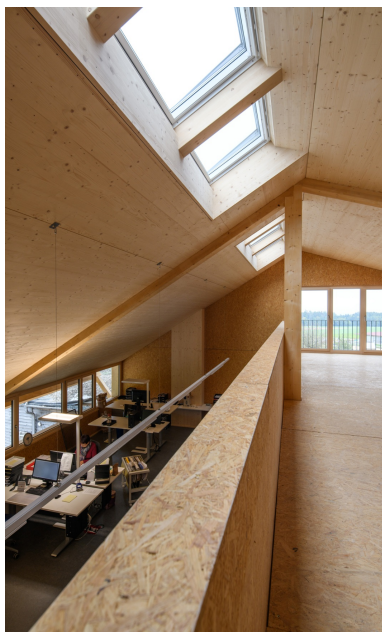
Postes de travail de bureau spacieux