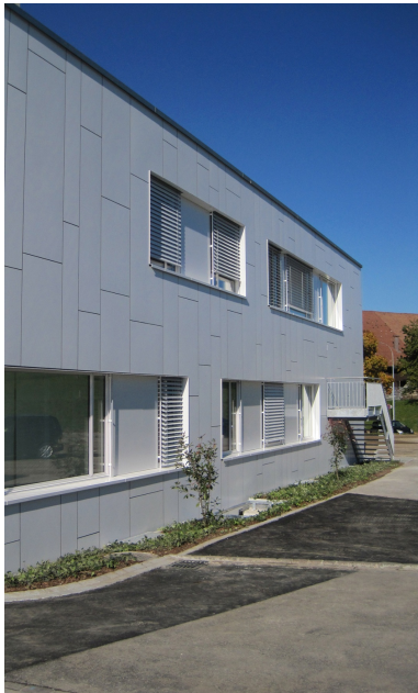
Bâtiment temporaire à deux étages