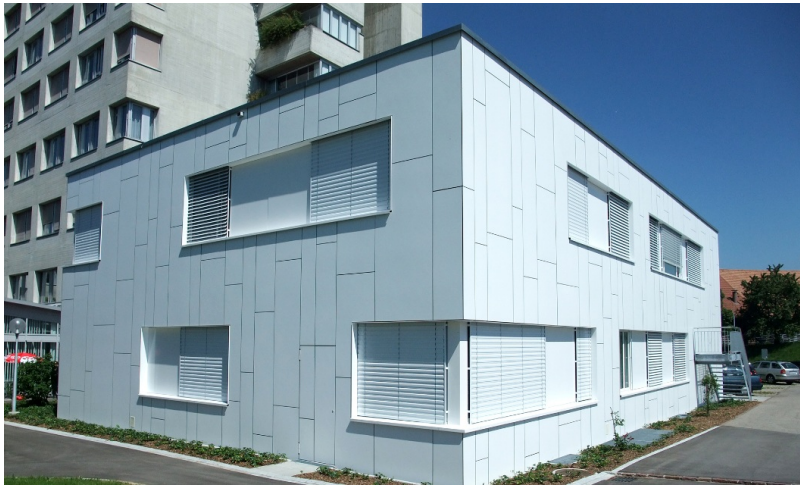
Bâtiment temporaire à deux étages