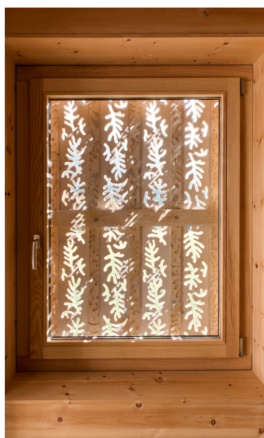
Les ornements de la façade sont également visibles à l'intérieur