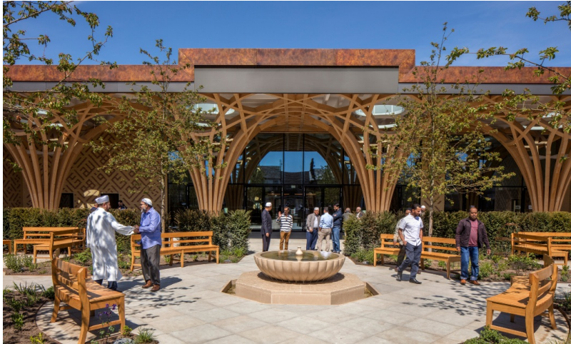
Vue de la cour intérieure de la mosquée