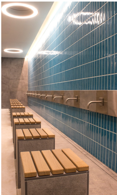
Espace pour le rituel de purification des fidèles