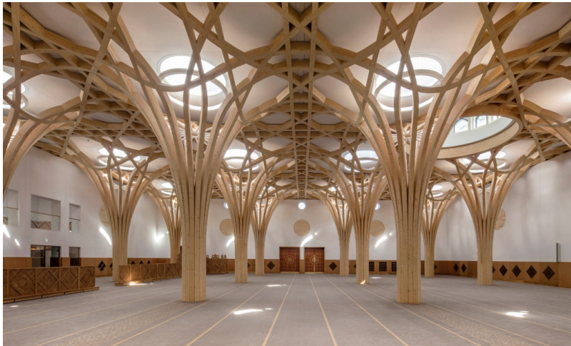
Salle de prière avec structure porteuse Free Form