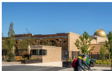
Vue extérieure de la mosquée de Cambridge