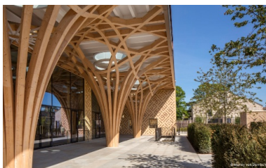
Zone d'entrée de la mosquée