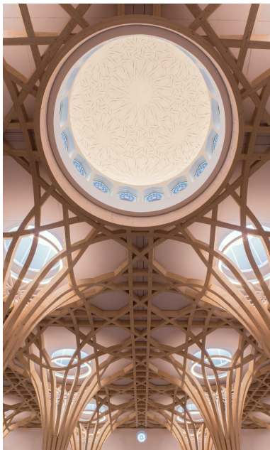
30 lucarnes laissent entrer beaucoup de lumière dans la mosquée