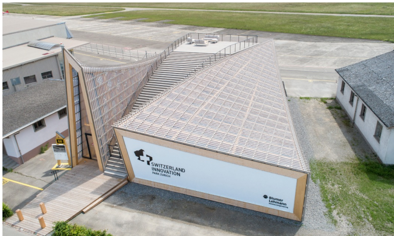
Objet phare du parc d'innovation