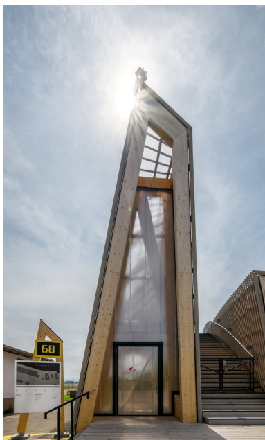
Zone d'entrée de l'enveloppe Free Form