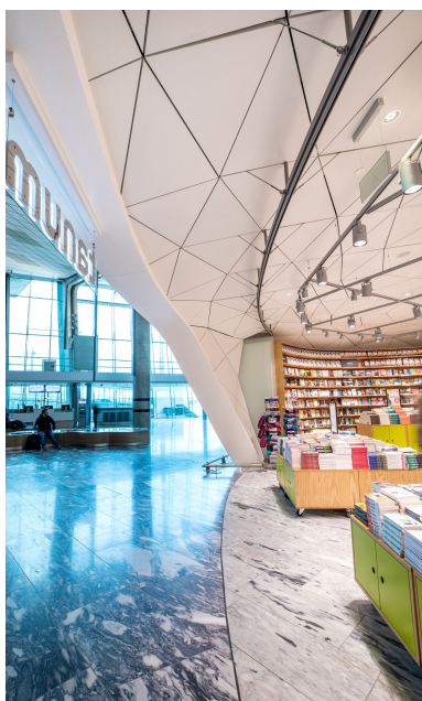
Vue détaillée de la construction en bois avec revêtement