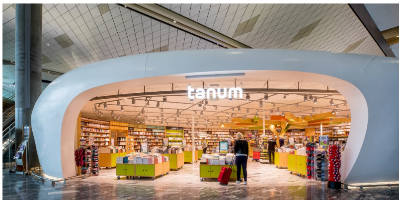
Pavillon dans la zone de transit